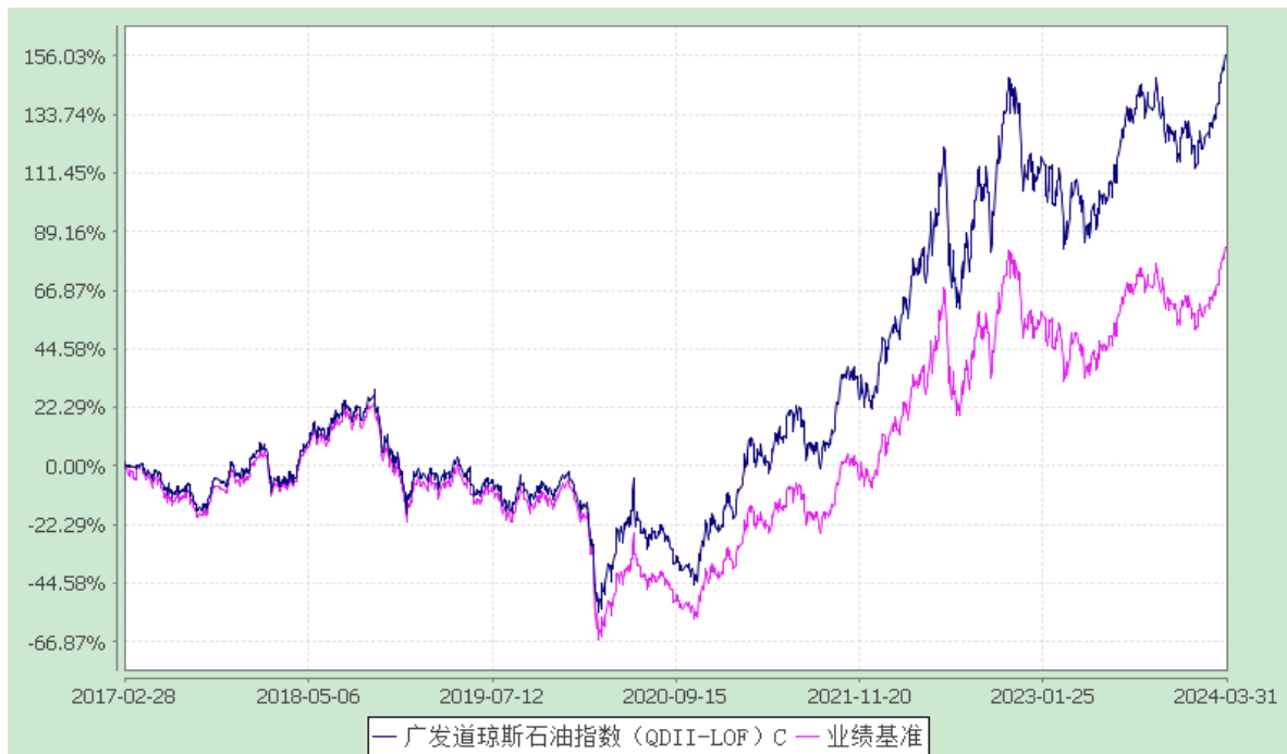
(3) 广发道琼斯石油指数 (QDII-LOF) E: