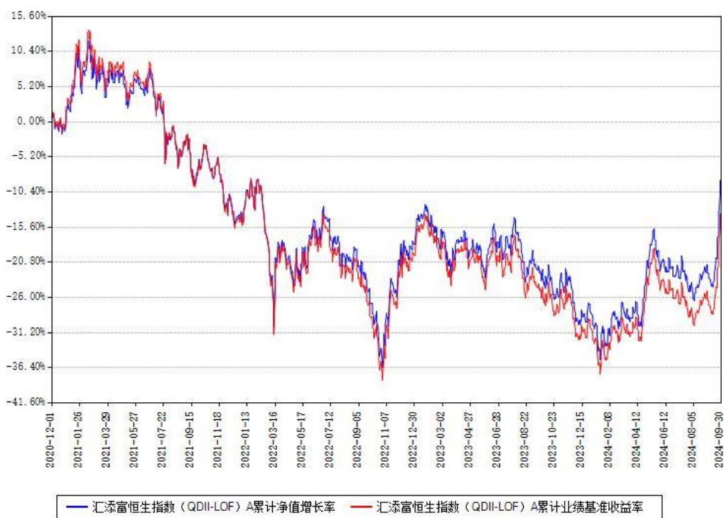
汇添富恒生指数 (QDII-LOF) A 累计净值增长率与同期业绩基准收益率对比图