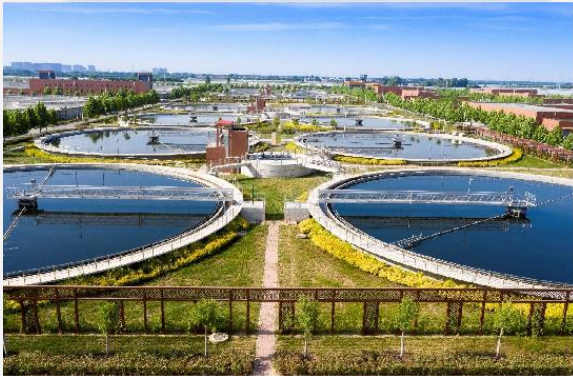
资源能源循环利用类标杆厂： 郑州新区污水处理厂