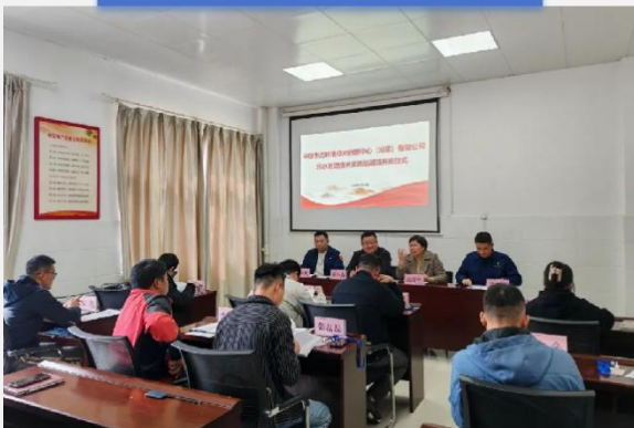
城镇污水处理运行管理培训