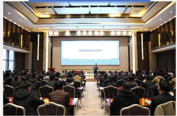
优秀年轻干部人才培训