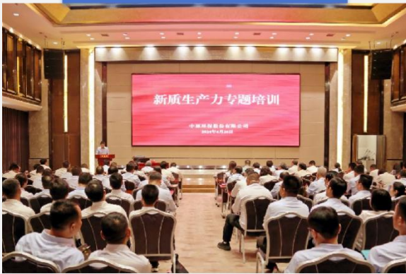
新质生产力专项培训