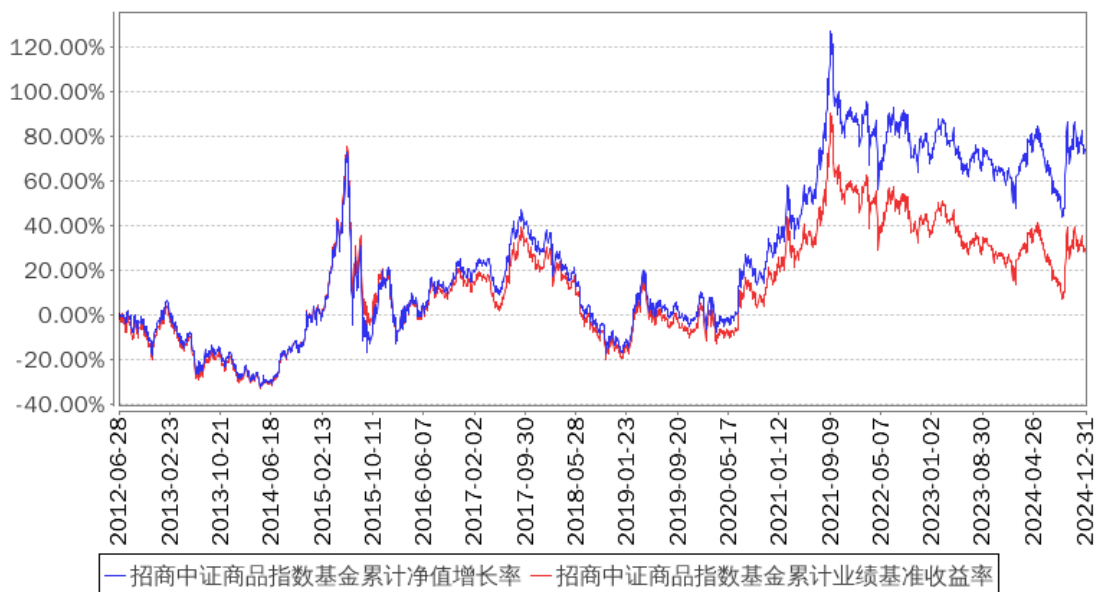
招商中证商品指数基金累计净值增长率与同期业绩比较基准收益率的历史走势对比图