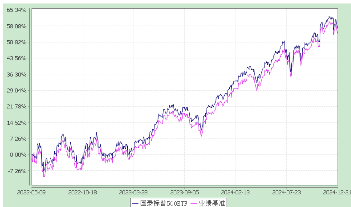
国泰标普 500 交易型开放式指数证券投资基金 (QDII) 份额累计净值增长率与业绩比较基准收益率历史走势对比图 (2022 年 5 月 9 日至 2024 年 12 月 31 日)

注：（1）本基金的合同生效日为 2022 年 5 月 9 日，在 6 个月建仓期结束时，各项资产配置比例符合合同约定。