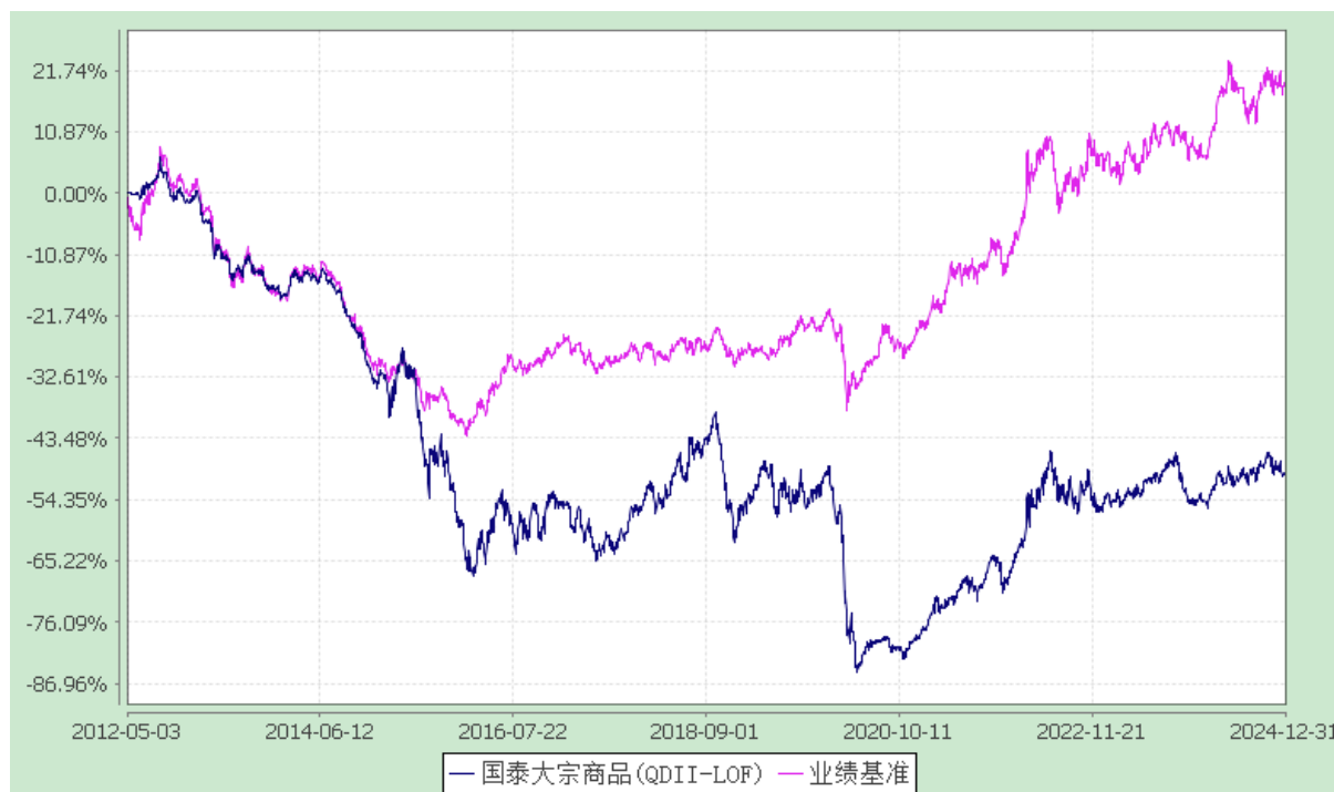
国泰大宗商品配置证券投资基金(LOF) 份额累计净值增长率与业绩比较基准收益率历史走势对比图 (2012年5月3日至2024年12月31日)