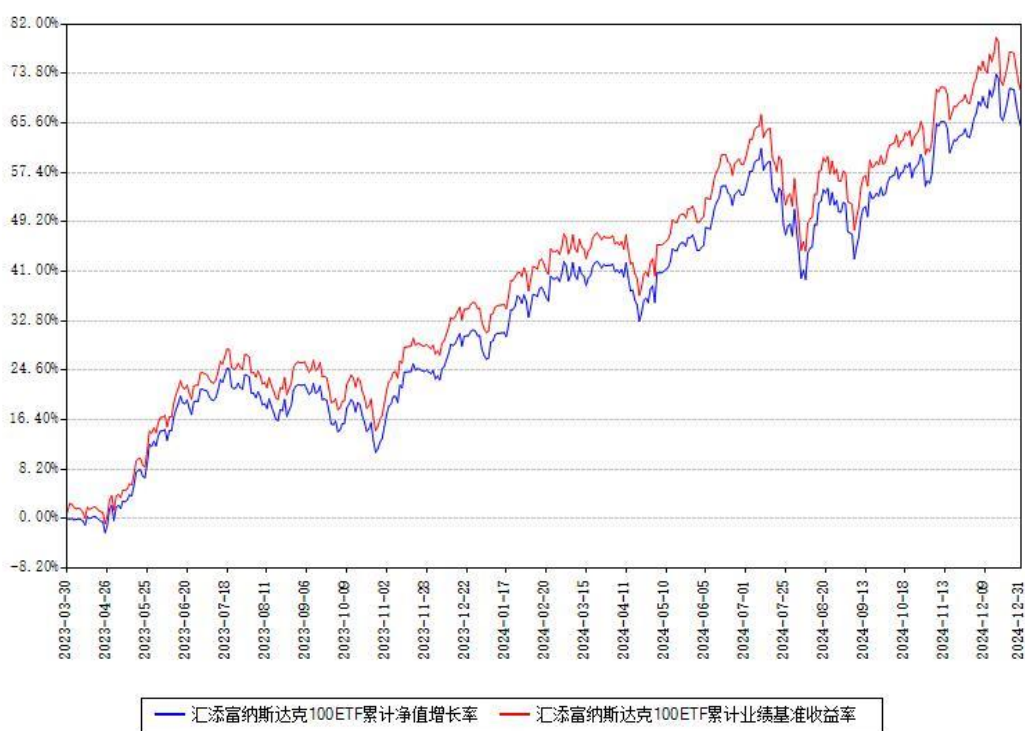
汇添富纳斯达克100ETF累计净值增长率与同期业绩基准收益率对比图

注：本基金建仓期为本《基金合同》生效之日（2023年03月30日）起6个月，建仓期结束时各项资产配置比例符合合同约定。