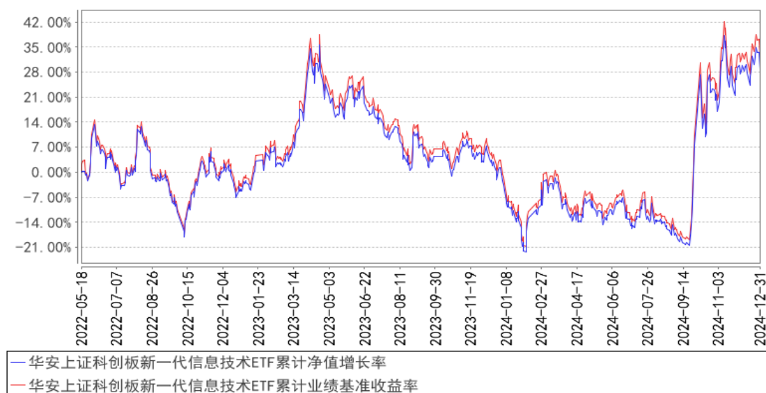
华安上证科创板新一代信息技术ETF累计净值增长率与同期业绩比较基准收益率的历史走势对比图