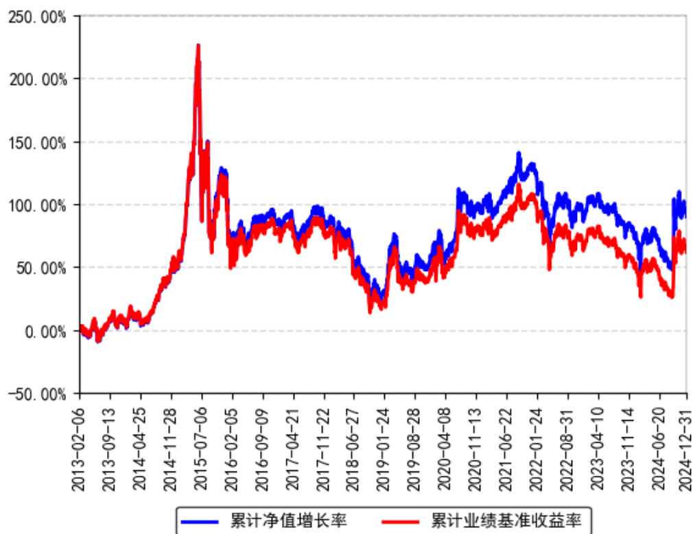
南方中证500ETF累计净值增长率与同期业绩比较基准收益率的历史走势对比图