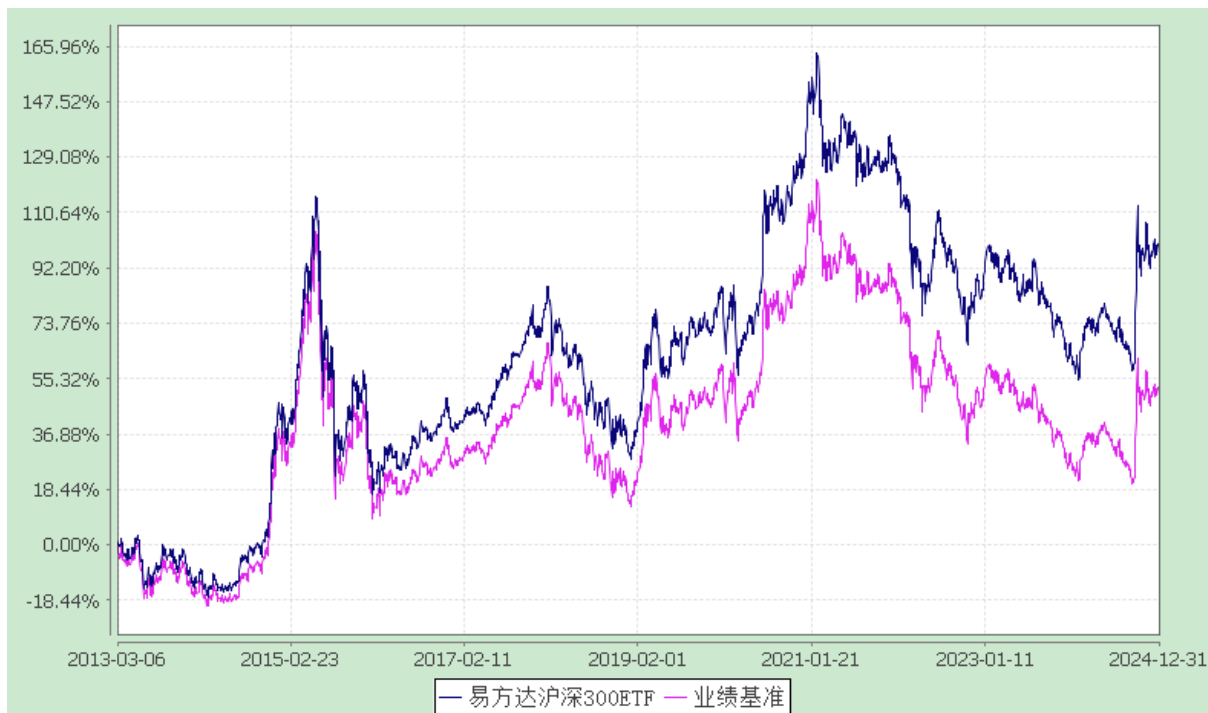
易方达沪深 300 交易型开放式指数发起式证券投资基金 份额累计净值增长率与业绩比较基准收益率历史走势对比图 (2013 年 3 月 6 日至 2024 年 12 月 31 日)

注：自基金合同生效至报告期末，基金份额净值增长率为 97.17%，同期业绩比较基准收益率为 50.03%。