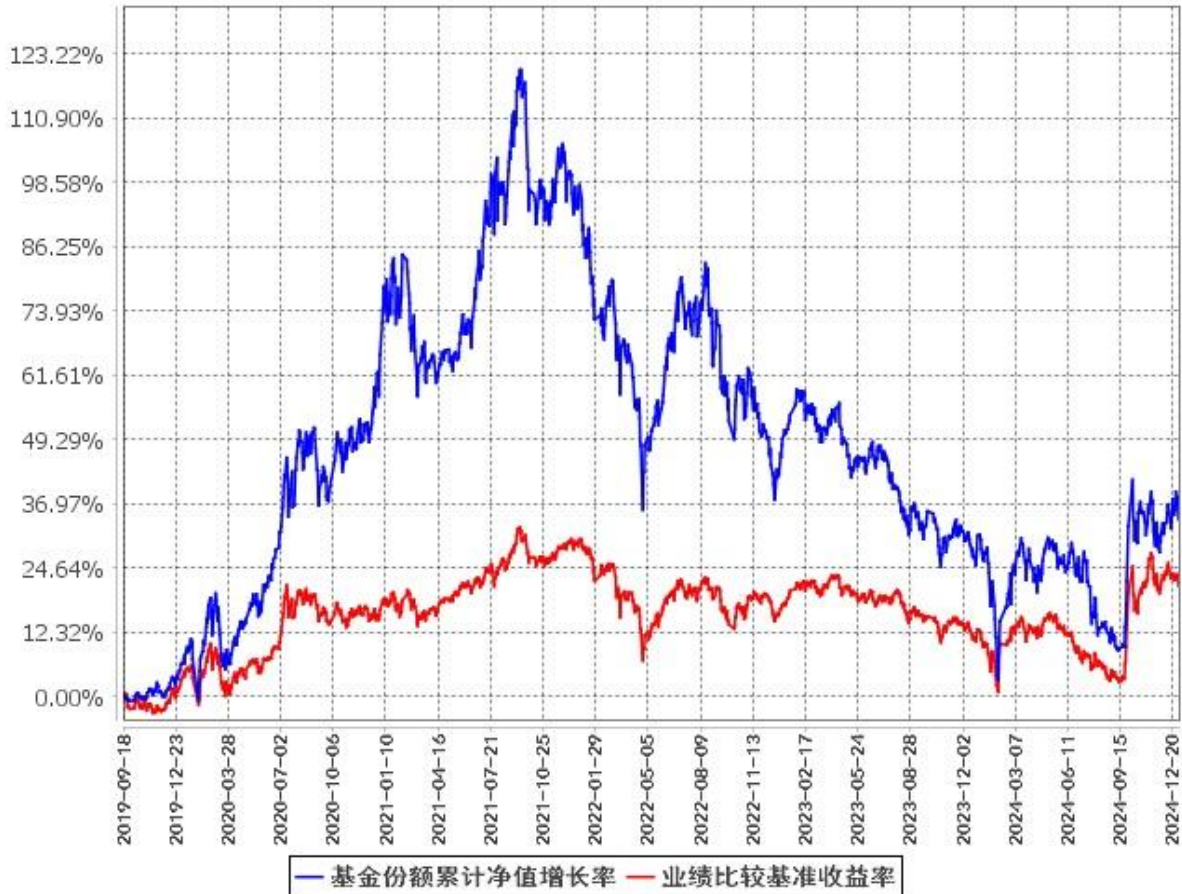
基金份额累计净值增长率与同期业绩比较基准收益率的历史走势对比图 (2019年9月18日至2024年12月31日)