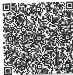
祁振东的年检二维码.png

本证书经检验合格 This certificate is valid this renewal.