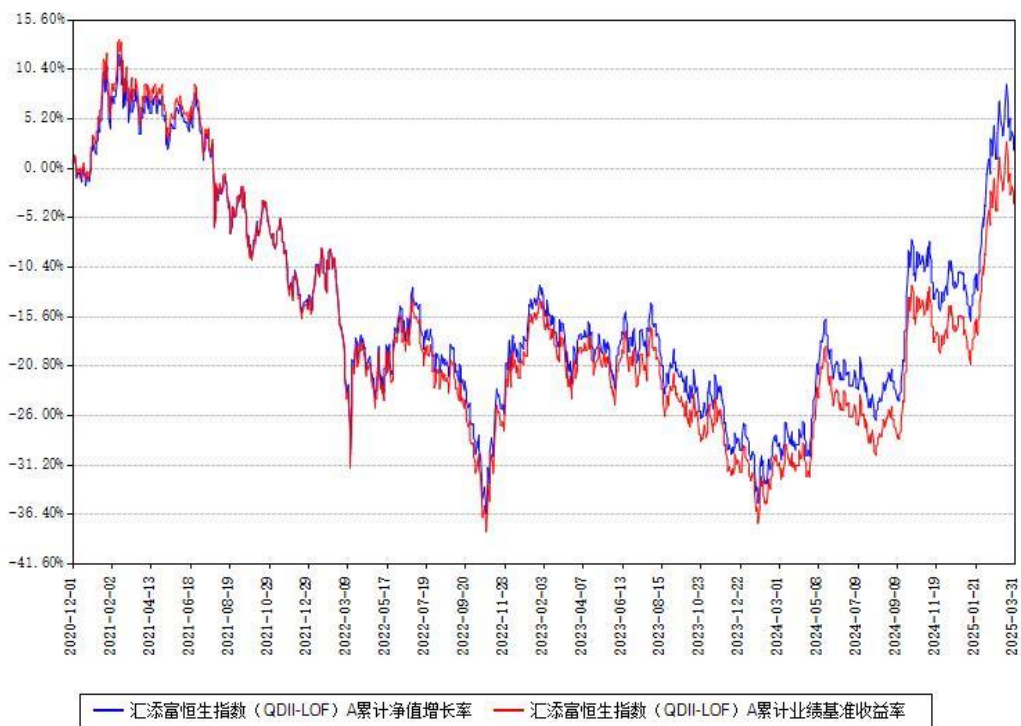
汇添富恒生指数（QDII-LOF）A 累计净值增长率与同期业绩基准收益率对比图