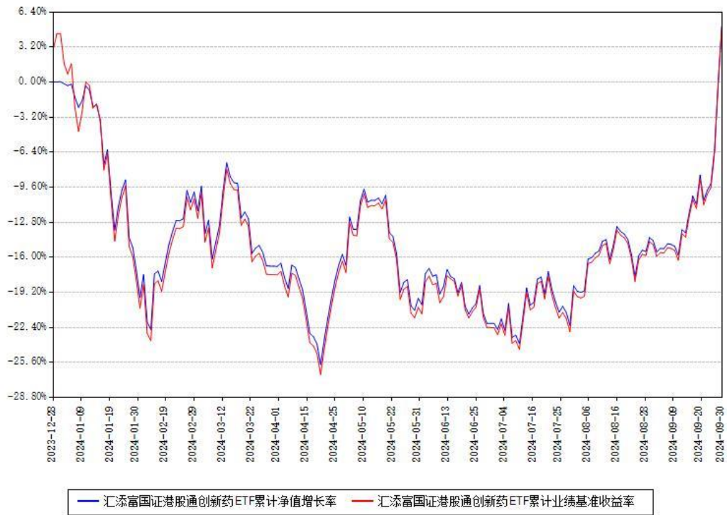
汇添富国证港股通创新药ETF累计净值增长率与同期业绩基准收益率对比图