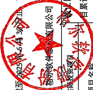
附表 2：截至 2025 年 6 月 30 日止 前次募集资金投资项目实现效益情况对照表