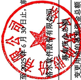
附表 1：截至 2025 年 6 月 30 日止，前次募集资金使用情况对照表