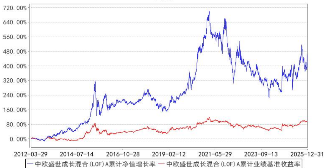
中欧盛世成长混合 (LOF) A 累计净值增长率与同期业绩比较基准收益率的历史走势对比图