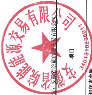
母公司所有者权益变动表