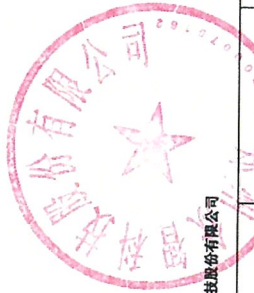
2025年度非经营性资金占用及其他关联资金往来情况汇总表