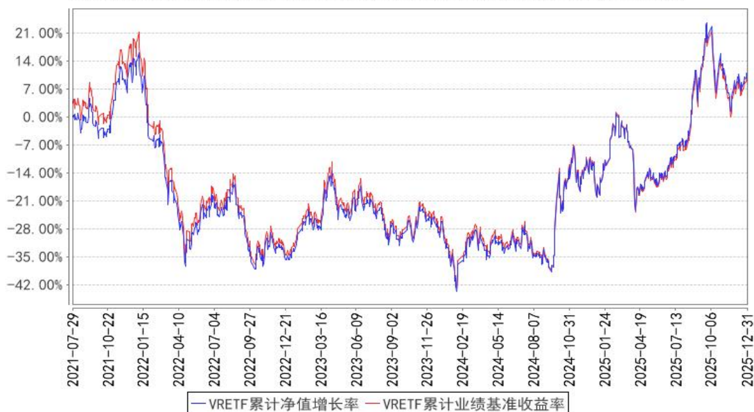
VRETF 累计净值增长率与同期业绩比较基准收益率的历史走势对比图

注：按基金合同的规定，本基金自基金合同生效起六个月内为建仓期，建仓期结束时本基金的各项投资比例已达到基金合同的规定：本基金标的指数为中证虚拟现实主题指数。本基金主要投资于标的指数成份股及备选成份股。在建仓完成后，本基金投资于标的指数成份股及备选成份股的资产比例不低于基金资产净值的 90%，且不低于非现金基金资产的 80%。每个交易日日终在扣除股指期货合约、股票期权合约需缴纳的交易保证金后，应当保持不低于交易保证金一倍的现金，其