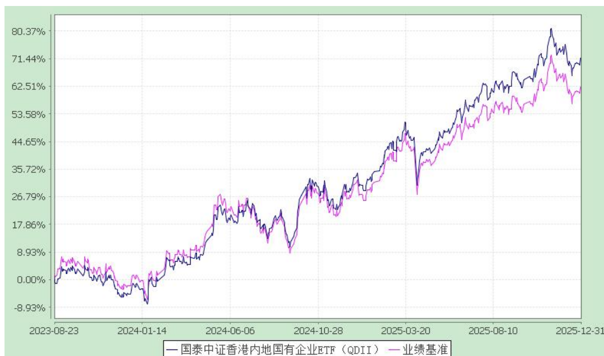
国泰中证香港内地国有企业交易型开放式指数证券投资基金（QDII） 份额累计净值增长率与业绩比较基准收益率历史走势对比图 (2023 年 8 月 23 日至 2025 年 12 月 31 日)

注：(1)本基金合同生效日为 2023 年 8 月 23 日，在 6 个月建仓期结束时，各项资产配置比例符合合同约定。