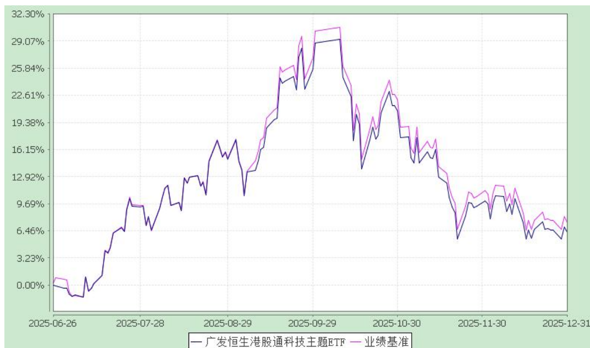
广发恒生港股通科技主题交易型开放式指数证券投资基金 份额累计净值增长率与业绩比较基准收益率的历史走势对比图 (2025 年 6 月 26 日至 2025 年 12 月 31 日)