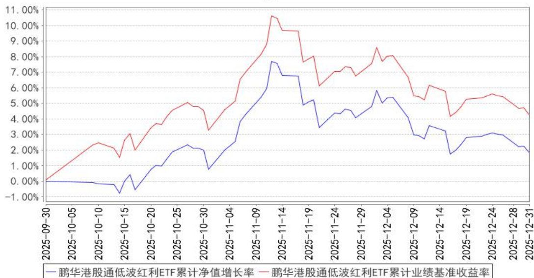
鹏华港股通低波红利ETF累计净值增长率与同期业绩比较基准收益率的历史走势对比图

注：1、本基金基金合同于 2025 年 09 月 30 日生效，截至本报告期末本基金基金合同生效未满一年。2、本基金管理人将严格按照本基金合同的约定，于本基金建仓期届满后确保各项投资比例符合基金合同的约定。