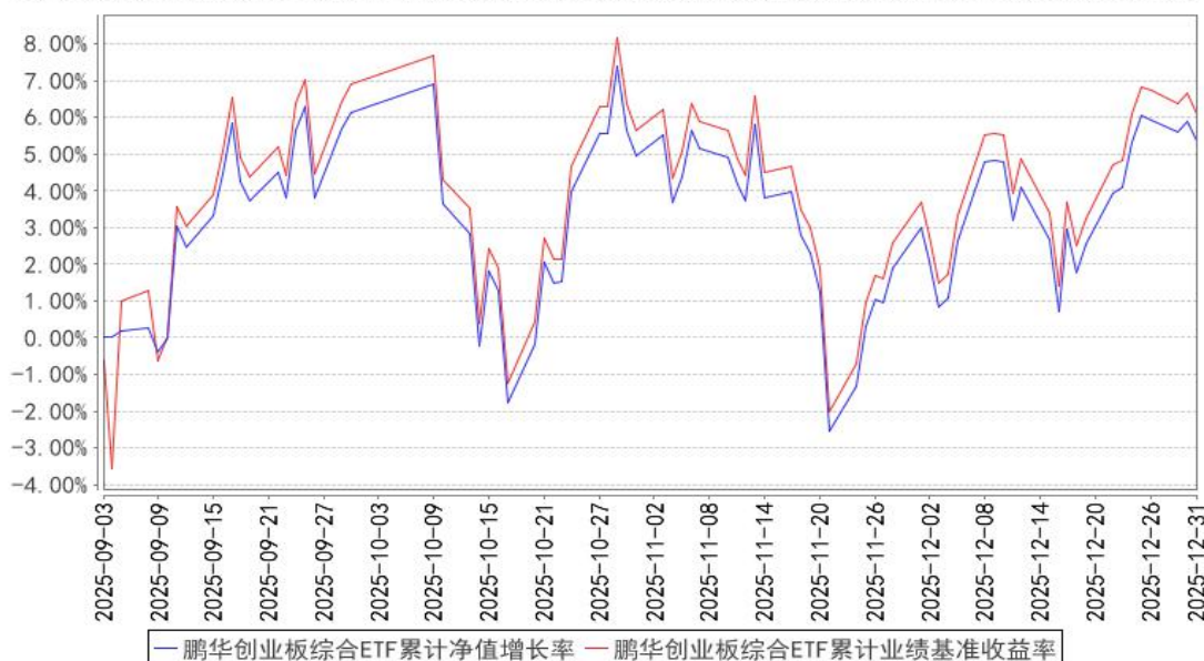
鹏华创业板综合ETF累计净值增长率与同期业绩比较基准收益率的历史走势对比图

注：1、本基金基金合同于 2025 年 09 月 03 日生效，截至本报告期末本基金基金合同生效未满足一年。