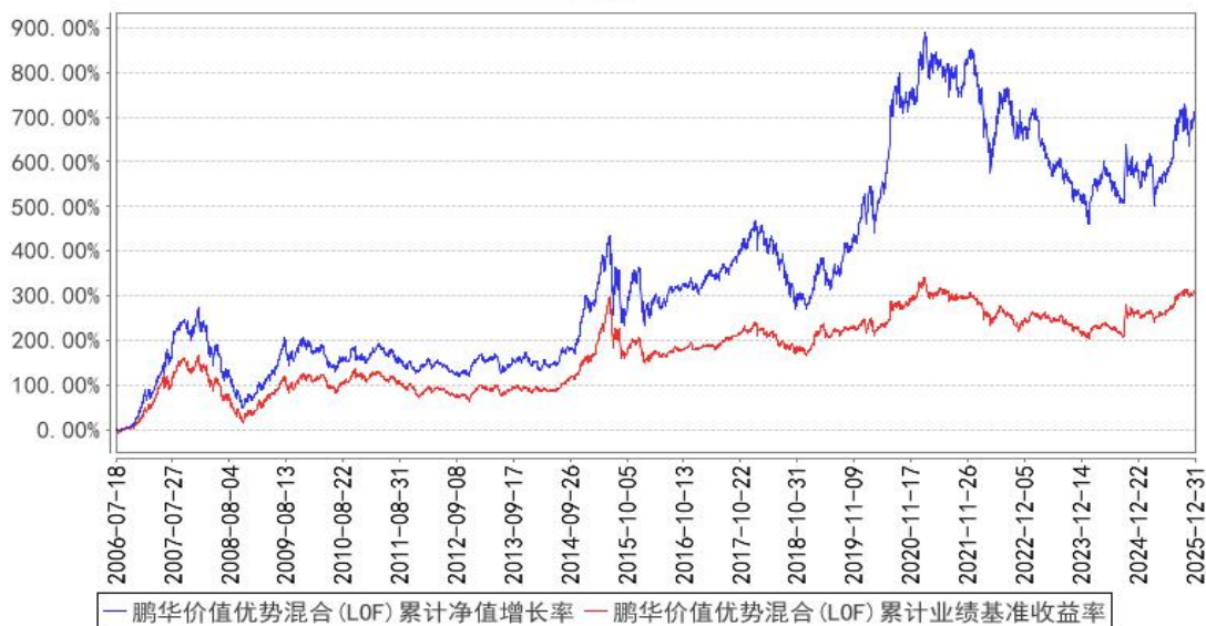
鹏华价值优势混合 (LOF) 累计净值增长率与同期业绩比较基准收益率的历史走势对比图

注：1、本基金基金合同于 2006 年 07 月 18 日生效。2、截至建仓期结束，本基金的各项投资比例已达到基金合同中规定的各项比例。