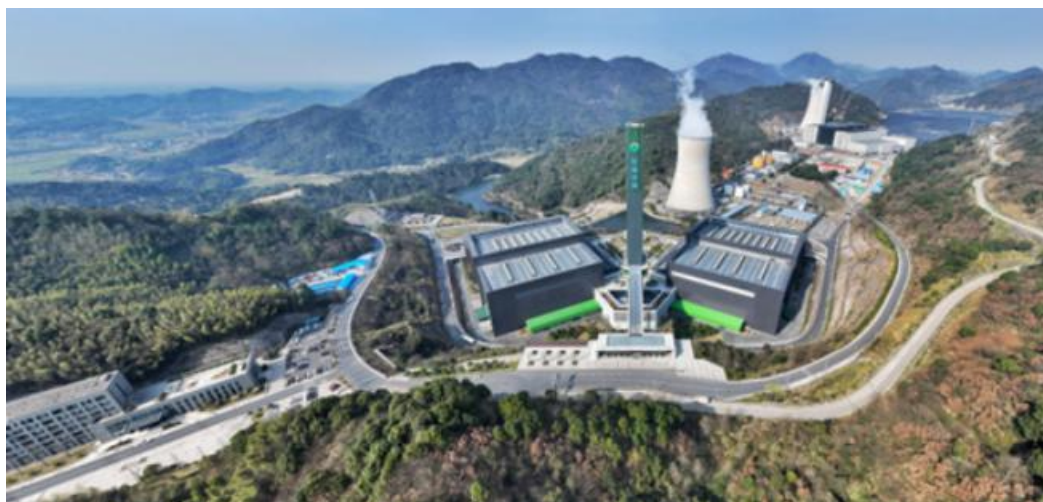
图 1 公司运营的长沙市黑麋峰园区（城市固体废弃物处理场）

公司凭借先进的管理和技术、良好的建设和运营能力、优质的项目成果获得了较高的品牌知名度和影响力，在中国湖南省与“一带一路”地区已有显著的行业和区域竞争优势。公司致力于打造高品质固废处理项目和绿色科技能源中心（绿电供应中心、绿色供热中心和绿色算力中心），并计划持续在国内以及中亚、东南亚、中东、南美等“一带一路”国家和地区的市场提供“军信解决方案”。