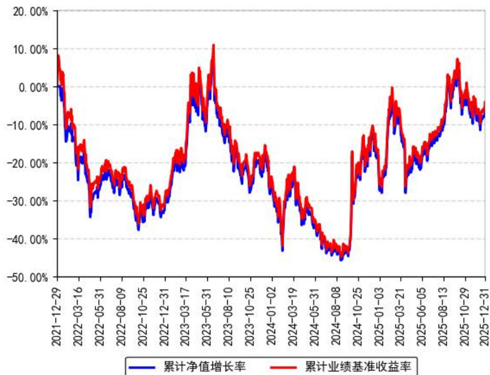
南方国证在线消费ETF累计净值增长率与同期业绩比较基准收益率的历史走势对比图