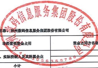
2025年度非经营性资金占用及其他关联资金往来情况汇总表