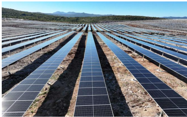
在建的波黑科曼耶山光伏项目 建成后将是波黑最大的光伏电站项目