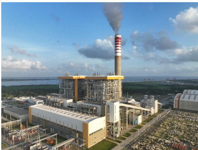
孟加拉博杜阿卡利 1320MW 燃煤电站项目 顺利通过首台机组可靠性运行试验

公司控股子公司北方物流有限公司主要提供以跨境综合物流为主的综合国际货运代理以及贸易物流服务，属于现代物流业。综合国际货运代理以国际项目物流为主，为客户制定专业化、个性化项目物流解决方案；贸易物流围绕货物采购及配套物流展开，为客户提供物流方案，资金安排，采购执行等综合服务。报告期内，公司国际物流业务引入中国物流股份有限公司作为新的战略投资者，打造具有国际经营产业背景、专业化发展格局的国际化物流平台；突破传统货代业务模式，持续提升特种物流、新能源、轨道交通等领域专业能力，打造综合物流解决方案；加快构建海外物流网络，重点围绕南部非洲、蒙古、东南亚三大区域打造属地化营销能力。