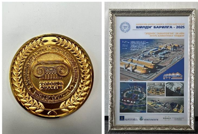
蒙古选煤厂项目成功斩获蒙古最优建筑奖（蒙古国建筑行业工程质量最高荣誉）