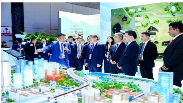
公司在第八届中国国际进口博览会展台