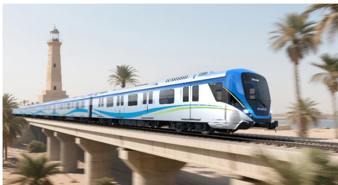
埃及阿布基尔地铁车辆项目（效果图）