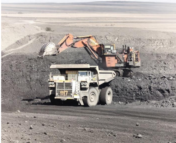
公司成为国务院认定的“三位一体”对蒙能源合作项目成员单位

公司全资子公司中国北方车辆有限公司专注于从事重型装备出口业务，积极构建以车辆（商用车和矿用车）、工程机械、石油机具为主营产品，以船舶、文化创意等为特色产品的专业化民品经营平台。积极开拓国别市场，带动集团公司产品、技术、服务走出去。建立健全海外售后服务体系，提升全寿命周期服务能力。