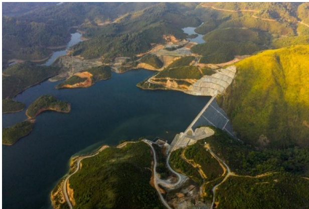
老挝南湃水电站项目投运五周年 累计发电突破 30 亿度