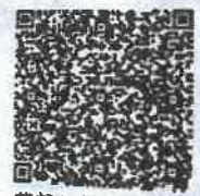
魏莎云年检二维码

本证书经检验合格, 继续有效一年。 This certificate is valid for another year after this renewal.