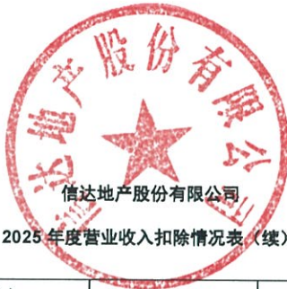
2025 年度营业收入扣除情况表 (续)