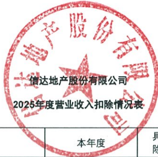
信达地产股份有限公司 2025年度营业收入扣除情况表