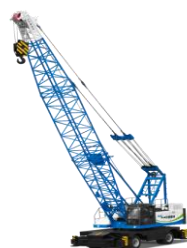
电动港口轮胎起重机