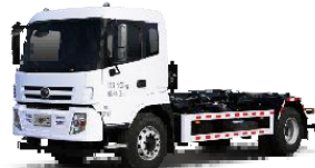
燃油车厢可卸式垃圾车