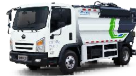
燃油自装卸式垃圾车