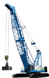
增程式电动强夯机