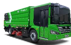
纯电动高速扫路车