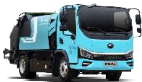
纯电动压缩式垃圾车