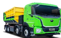
纯电动车厢可卸式垃圾车