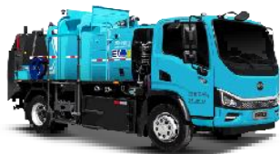
纯电动餐厨垃圾车