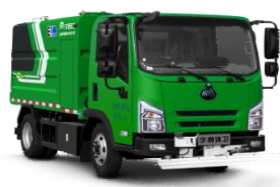
纯电动路面养护车