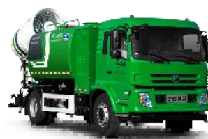
纯电动多功能抑尘车