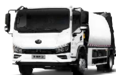
燃油压缩式垃圾车