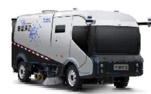
纯电动自动驾驶洗扫车