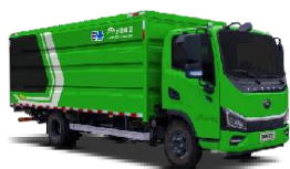
纯电动密闭式桶装垃圾车