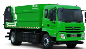
纯电动对接式垃圾车