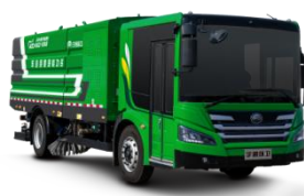
纯电动道路污染清除车