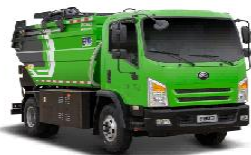
纯电动自装卸式垃圾车