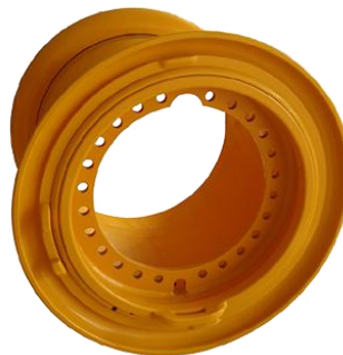
图 4：农林工矿机械非公路钢轮