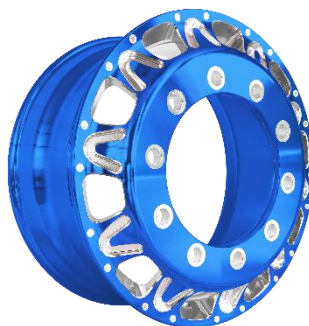
图 2：卡客车锻造铝合金轮毂