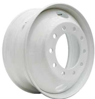
图 1：卡客车钢制轮毂

公司车轮业务的主要产品为钢制轮毂和锻造铝合金轮毂，这些产品广泛应用于国内外客车、货车、牵引车、微卡、特种车辆等商用车领域，报告期内公司还新开发了非公路车型的钢制轮毂，轮毂直径范围为 6-14 英寸、15-54 英寸，产品可应用于拖拉机、农林机械、工程矿卡等非公路车型，目前 30.5x28、38xW10 规格已实现量产。公司目前拥有厦门、四川南充、越南北宁省、越南广宁省、漳州华安、唐山曹妃甸、印尼 7 个地区 10 个车轮生产基地，产品链齐全，可满足国内外整车厂和售后市场客户各种需求，“日上”车轮已经成为国内领先的车轮品牌。