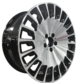
图 3：乘用车改装锻造铝合金轮毂