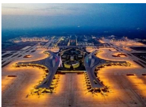
图 7：NCC 钢结构应用于大跨度公共建筑