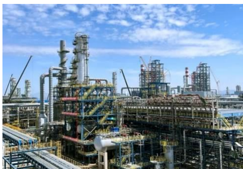
图 5：NCC 钢结构应用于石油化工领域

公司钢结构业务以钢结构的设计、制造和安装为主，以配套金属围护系统为辅。产品涵盖建筑钢结构、设备钢结构以及钢结构桥梁等，重点深耕石化设备钢结构工程、市政桥梁及轨道交通、大型高端工业厂房、高层钢结构建筑等四大细分领域。其中，公司在石油炼化及化工领域的钢结构制造方面具备独特竞争优势。经过三十年的发展，公司已在钢结构领域完全树立了“新长诚”“NCC”品牌的良好市场影响力。