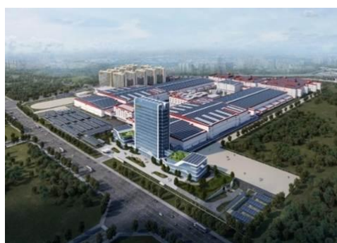
图 6：NCC 钢结构应用于高端电子厂房