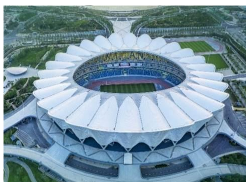
图 8：NCC 钢结构应用于体育场馆