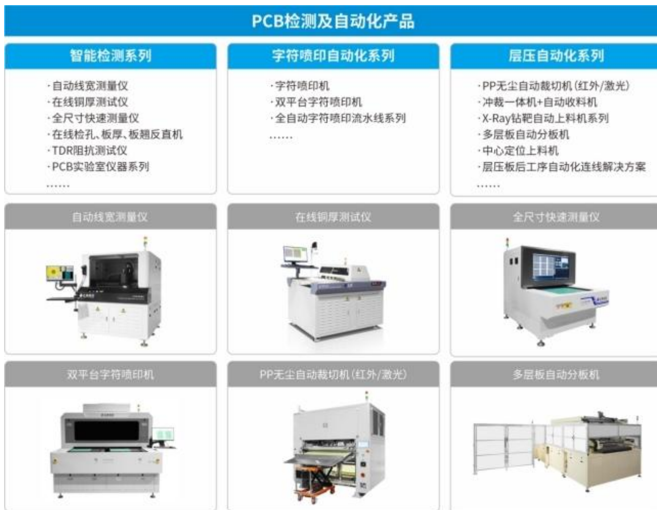
*部分产品展示,产品描述及外观仅供参考

公司在 PCB 行业拥有二十多年的技术沉淀，积累了丰富的项目经验和客户资源，产品覆盖大部分 PCB 制程工序的检测和自动化加工需求，包括线宽测量、铜厚测试、板厚测量、尺寸测量、板弯板翘检测、检孔、阻抗测试、PCB 实验仪器等检测产品，以及 PCB 字符喷印自动化、层压自动化等多种自动化设备解决方案。