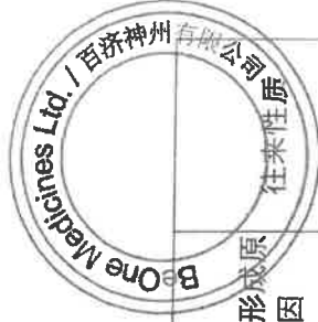
百济神州有限公司2025年度非经营性资金占用及其他关联资金往来情况汇总表