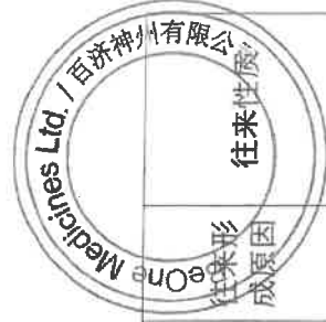
百济神州有限公司2025年度非经营性资金占用及其他关联资金往来情况汇总表