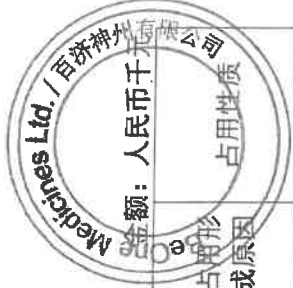
百济神州有限公司2025年度非经营性资金占用及其他关联资金往来情况汇总表