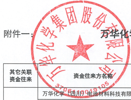
附件一：万华化学集团股份有限公司 2025 年度非经营性资金占用及其他关联资金往来情况汇总表（续）