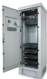
一体化能源柜解决方案