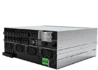
模块化电源解决方案