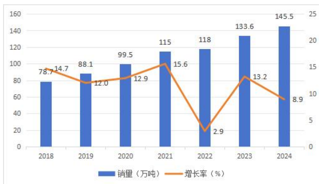
近年来我国粉末涂料用聚酯树脂市场情况

头替代，倒逼涂装厂采用粉末涂装，这一现象近几年逐步增多，必将带来“漆改粉”的加速，绿色发展为粉末涂料行业创造了最佳机遇期。2023 年以来在新能源汽车、钢结构、集装箱等新领域实现了巨大突破，越来越多的新兴领域开始关注并转向粉末涂装。粉末涂料正在被越来越多的政府和市场主体认知和认可，环保性能突出的粉末涂料及其主要原料聚酯树脂将直接受益，进而有效促进公司的业务发展。根据中国化工学会涂料涂装专业委员会的统计，2018 年至 2024 年我国聚酯树脂市场销售总量分别为 78.7 万吨、88.1 万吨、99.5 万吨、115 万吨、118 万吨、133.6 万吨、145.5 万吨，年复合增长率达 10.79%。