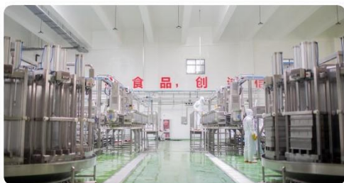
规模化生产与多元化品类双重驱动，打造核心竞争力