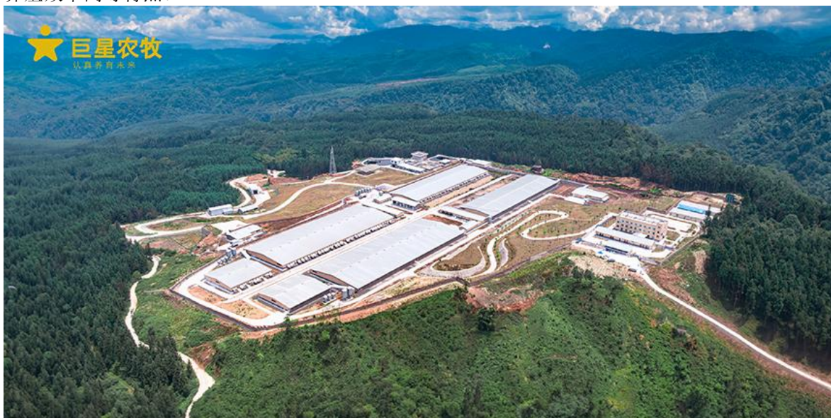
图 1：巨星农牧现代化平层猪场

相较于传统猪场，现代化猪场需要大量的资金投入，市场参与者把猪场设计作为保障养殖效率的关键点，充分考虑科学选址、生物安全等因素，推动符合环保和产品安全要求的规模化、现代化、生物安全化的生猪养殖场建设。现代化猪场相较于传统猪场，有防疫能力强、环保能力强、养殖效率高等特点。