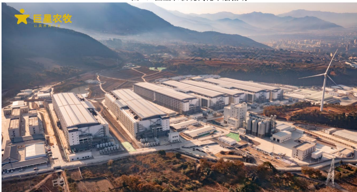
图 2：巨星农牧现代化楼房猪场

此外，现代化生猪养殖行业已从传统的育肥逐渐延伸至集基因筛选、种猪选育、动物疫病防治、科学饲料配比等跨越多体系、多学科的系统性工程，市场参与者需综合考量育种效率、料肉转化率、日增重、病死率、饲料成本等多因素，不断提升养殖技术、优化养殖管理，并及时捕捉市场信息，对市场周期波动做出正确判断。生猪养殖行业已不再是简单的劳动密集型产业，养殖门槛的提升进一步加快我国生猪养殖行业现代化进程，助推我国生猪养殖行业向技术密集型、知识密集型产业的转型升级。