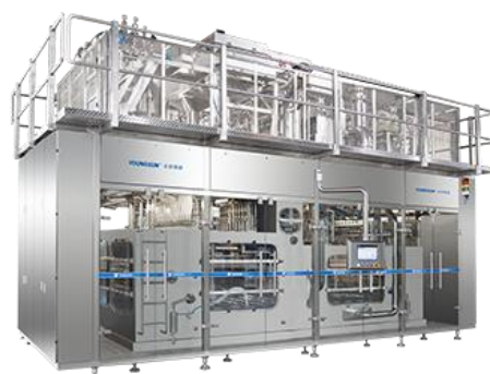
超洁净/无菌直线型塑瓶灌装机系列