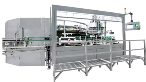
玻璃瓶灌装机系列