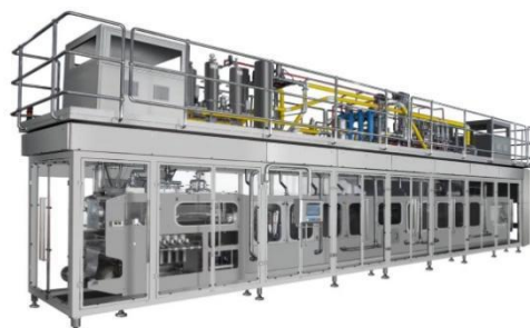
超洁净/无菌直立铝塑膜复合袋灌装机系列