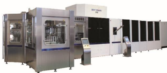
超洁净/无菌吹灌旋一体机系列