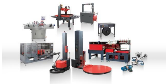
小型标准单机设备系列