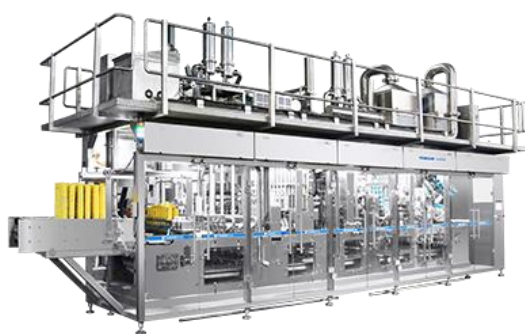
全自动纸塑杯灌装封口机系列