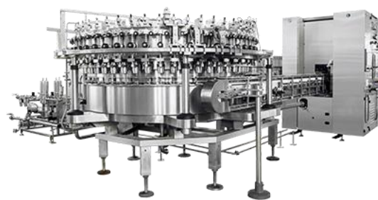
易拉罐灌装机系列