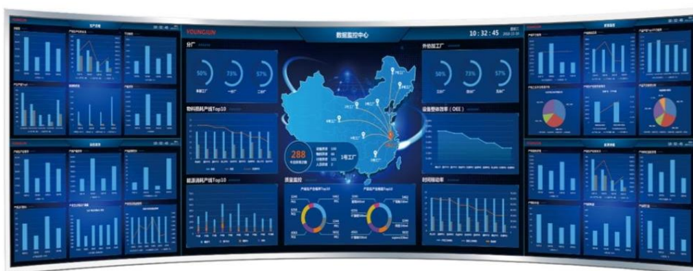
永创智能 DMC 平台