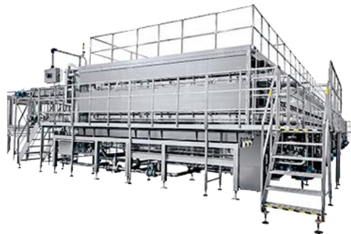
节能型杀菌机系列