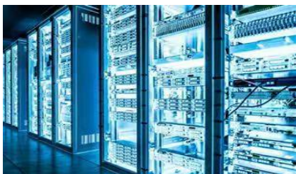
智能布线/数据中心产品

公司主要通过参与项目投标方式获取业务机会。根据项目需求设计方案、生产或采购客户所需的设备，并负责安装、调试和系统集成，按照合同价款扣除成本后实现利润。公司的经营业绩主要受央企、政府、金融等行业客户的资本开支、信息化投入及招投标结果、原材料价格波动及其他成本的变动等因素影响。