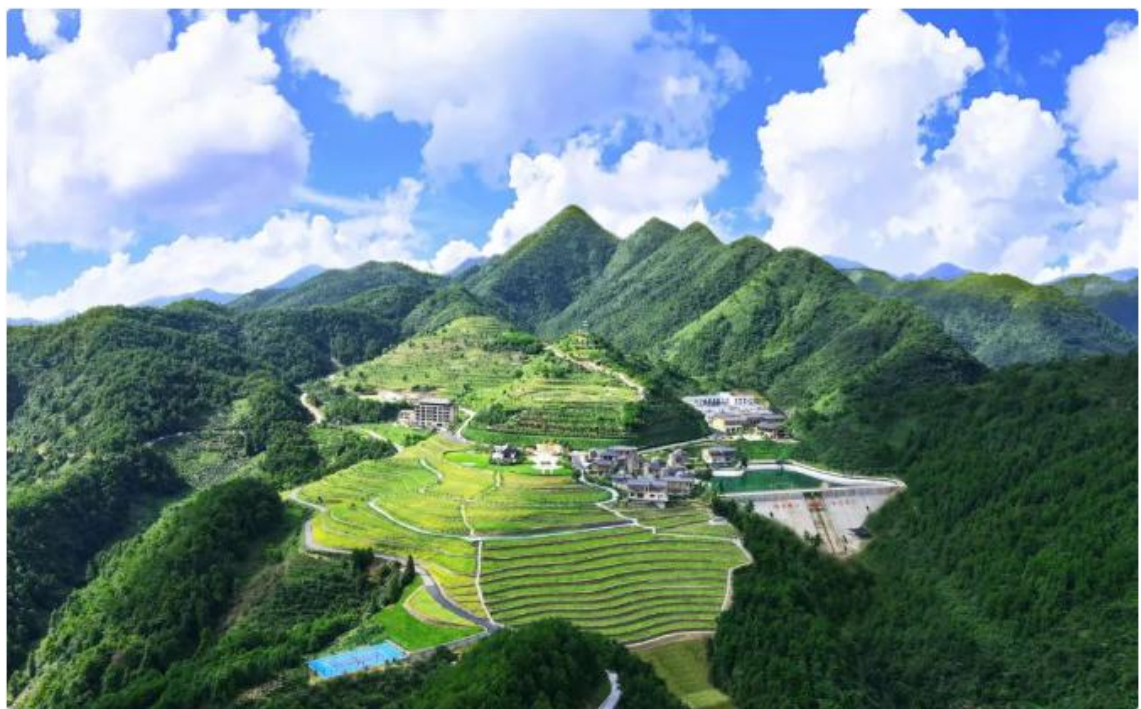
>> 胡家坪村实景照片

自 2021 年 9 月 16 日项目启动以来，公司“乡村振兴、共同富裕”事业进展顺利，并取得了显著成果。