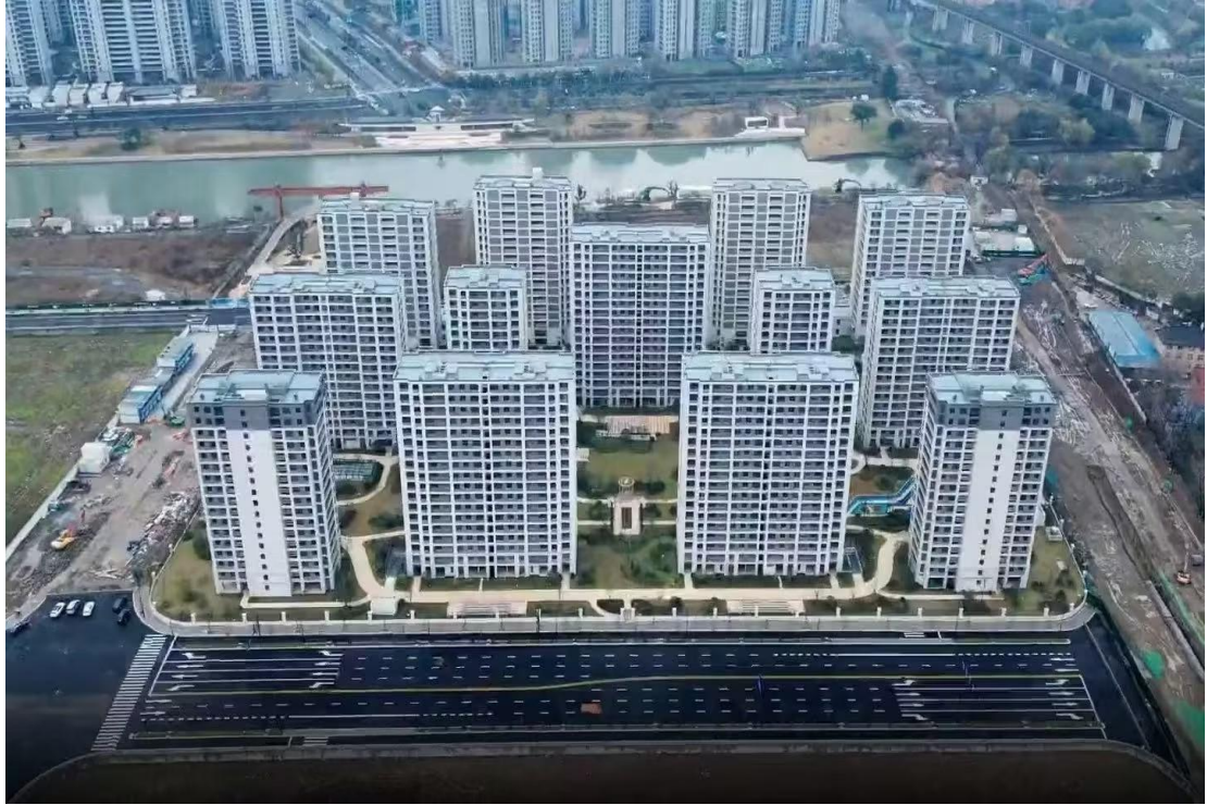
沈家桥安置房项目实景图