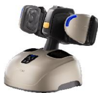
RT75分离式腿足按摩器