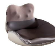
RT60pro腰臀一体按摩坐垫