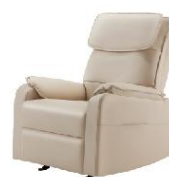
云瑶舒适智能沙发按摩椅