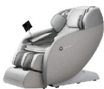
智能4D悬浮舱按摩椅