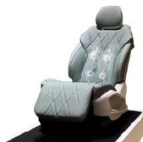
车载4D智能按摩机芯