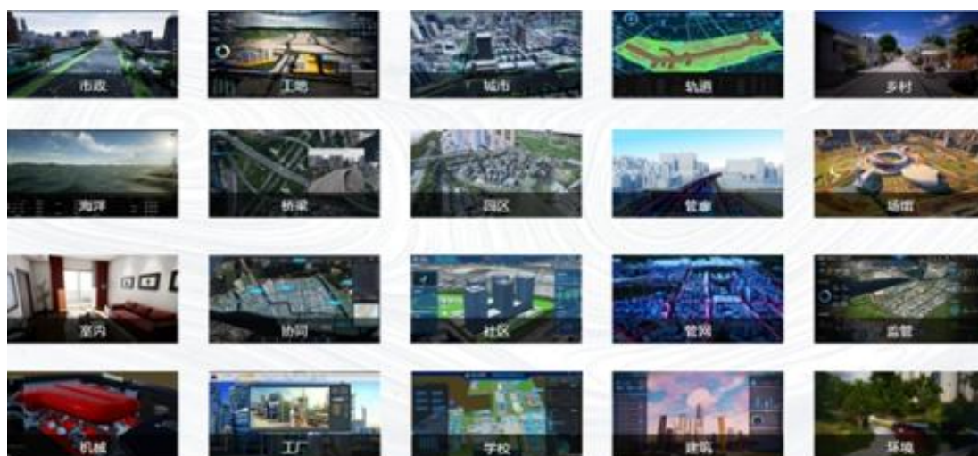
数字孪生业务应用方向

提亚数科以城市基建/生态建筑等要素搭建三维数字城市底图，实现三维立体世界场景和实时图形呈现与应用的探索与实践，打造数字孪生。提亚数科在对城市基建/生态/建筑等要素搭建数字三维城市底图，接入物理世界大数据长期研发和实践中积累和掌握了众多先进技术、积累了大量 3D 数据资产和数据可视化解决方案；提亚数科基于次世代引擎二次开发的提亚引擎作为全流程数据驱动的一站式生产平台，近年来一直在持续升级和迭代。提亚引擎强大的渲染和交互能力为提亚数科在数字孪生领域的深入开发增强底层技术实力，极大提升了提亚数科在大数据专业化展示领域的广度和深度。2025 年，提亚数科持续为城市、产业可持续发展提供数字化转型工具，携手多方共建数字化转型业务新生态。