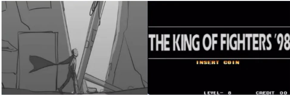
创作人大赛部分优秀作品展示

还举办了“掌趣游戏人创作大赛”，吸引了国内外 60 余所院校、超过 150 名游戏爱好者参与，其中数名优秀选手获得公司 offer，赛后成功入职公司。