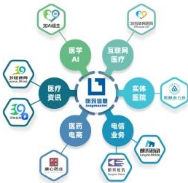
朗玛互联网医疗生态系统

2024 年度，因公司对收购启生信息 100% 股权形成的商誉所在资产组计提商誉减值准备 56,648.16 万元，致使公司合并口径归属于上市公司股东的净利润出现亏损，亏损金额为 51,209.97 万元。2025 年，公司实现归属于上市公司股东的净利润 934.15 万元；同时，实现归属于上市公司股东的扣除非经常性损益后的净利润 521.65 万元，同比实现扭亏为盈。