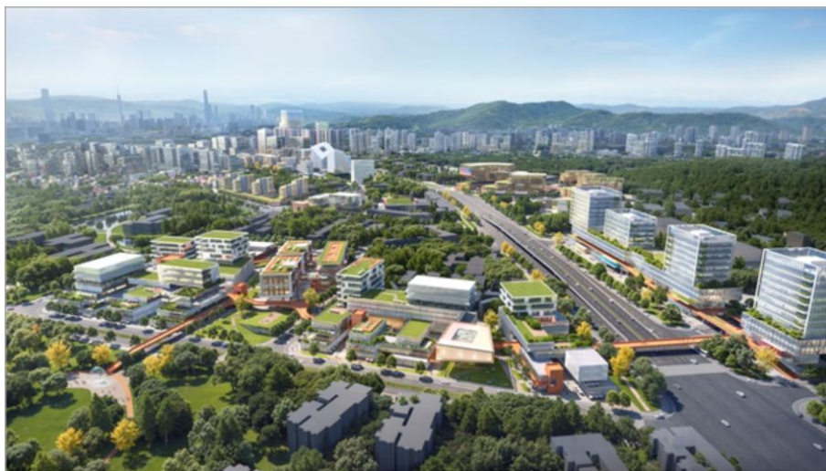
广州元岗-长湴片区整体策划

（全息）成像系统、裸眼 3D、城市 CIM 底座、应用软件开发等）。公司持续以创新动力提升 3D 可视化及数字多媒体交互技术的研发与制作能力，助力 3D 数字新体验。