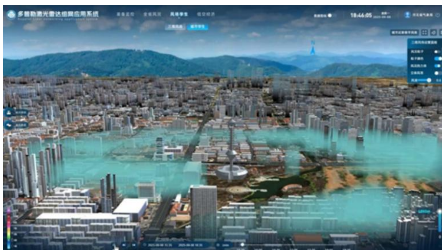
河北省气象局风场数字孪生仿真平台