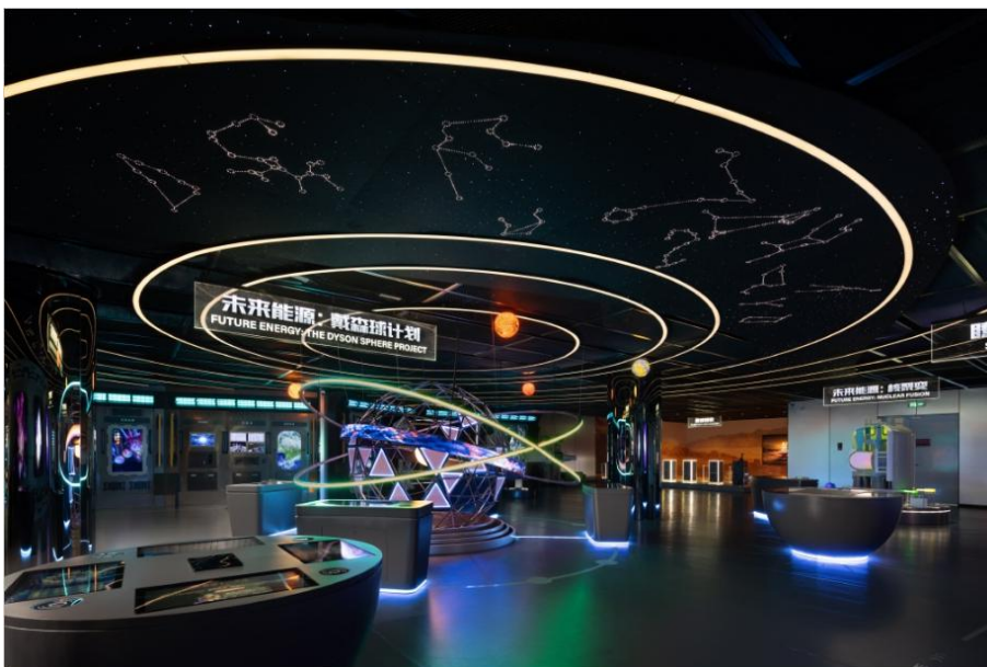
平顶山市文化传承与实践教育基地