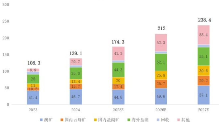
2023年-2027年全球锂供给预测（万吨 LCE）

全球能源转型和绿色可持续发展的大背景下，锂作为动力电池的重要原料，在新能源汽车、储能等应用领域具有长期和刚性的需求。同时锂也被广泛应用于生物医药、航空装备、新兴金属功能材料等产业，锂矿作为各国战略资源的重要地位日益凸显。全球锂资源区域分布不均衡，分别以盐湖形式存在于玻利维亚、阿根廷、智利三个南美国家以及中国等，以硬岩锂矿形式存在于澳大利亚、中国以及北美、非洲等地区国家。民生证券研究院数据显示，2025 年全球锂供给将增加 35.2 万吨 LCE 至 174.3 万吨 LCE，增幅达 25%，澳矿、非洲矿、南美盐湖新增产能释放构成主要增量。2025—2027 年仍有新增产能按规划建设中，预计 2027 年全球总供给将达到 238.4 万吨，2025 年到 2027 年的复合增长率为 11%。