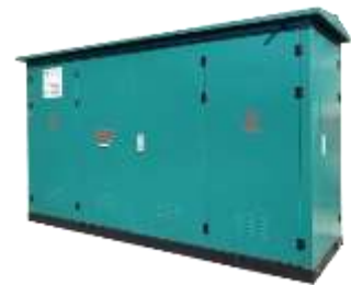
一、二次融合环网箱