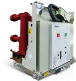
户内中压真空断路器 (弹操式)