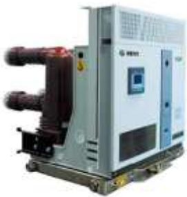
户内中压真空断路器 (永磁式)