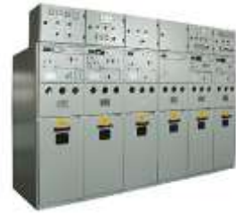
固体绝缘环网开关设备