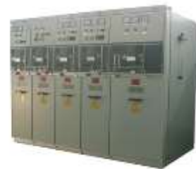
空气绝缘 SF6 灭弧环网开关设备