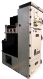
环保气体绝缘金属封闭开关设备