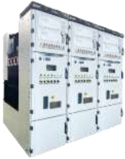
SF6 气体绝缘金属封闭开关设备