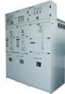
空气绝缘环网开关设备