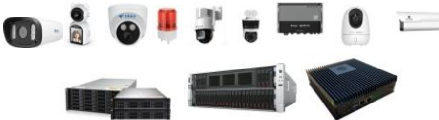
图 8：安徽赛达智能终端设备

研发的业软件平台及视觉算法的不断优化，赋能运营商及其他渠道合作伙伴，攻坚农业农村、林业、环保、国土、水利等政府客户，助力政府实现信息化及数字化升级。同时，针对 C 端客户及中小型企业客户，提供优质的视频监控终端，协助运营商占领家庭及商客市场。