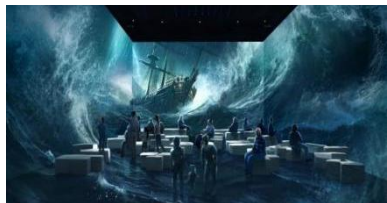
图 2：广东省水下文化遗产保护中心陈展项目