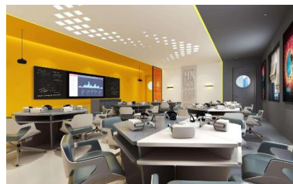
图 5: VR 未来教室效果图

报告期内，CG/VR 数字影像产品团队承接了部分外部 CG 和 AI 创新视效服务。公司承制了炎央（天津）文化发展有限公司 S 级动画番剧《仙剑三》（腾讯平台）的全流程镜头及部分角色道具场景资产制作，其中《仙剑三》使用公司自主研发的全 UE5 流程制作。同时，公司为地方文旅、部分游戏公司、互联网平台公司、影视动画公司出品的 CG 或 AI 作品提供了技术支持，包括：为北京百度网讯科技有限公司的 AI 换脸“S 级长剧集”项目