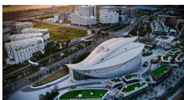
图 1：珠海横琴中医药科技创意博物馆项目实景图

LBE 城市新娱乐业务主要为客户提供从创意制作到实施建设的一站式服务。通过故事创意、场地游戏玩法设计、数字特效等内容创作以及特殊装置及设备、用户交互系统等研发制作提升主题场馆的内容表现力，公司根据客户需求提供整体方案策划、设计、实施及资源整合等服务。公司 LBE 业务包括珠海横琴中医药科技创意博物馆项目、陶阳里历史文化旅游区数字化内容提升项目、广东省水下文化遗产保护中心陈展项目等。