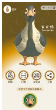
图 3：陶阳里历史文化旅游区数字化内容提升项目

报告期内，公司承接多个文化展示与数字化体验项目，涵盖博物馆、景区、遗产保护和 VR 技术应用。广东省水下文化遗产保护中心陈展项目通过装备陈列和数字场景，呈现