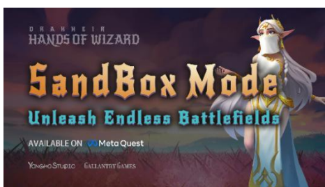
图 4: "Drakheir"

VR 教育方面，基于素质教育市场的普遍需求，公司推出了 VR 教育整体解决方案，通过提供硬件设备、软件系统、完整课程体系及培训运维服务，打造沉浸式、交互式的体验课堂。主要产品包括面向幼儿园用户的 VR 教育产品：太空学院-VR 未来教室和太空学院-VR 科探区，包含 VR 专注力探究课程、VR 编程课程、VR 爱国主义专题课程，以及面向中小学校用户的 VR 系列教育产品，包含 VR 科普课程、VR 专注力探究课程、VR 爱国主义专题课程、VR 中医药主题课程。