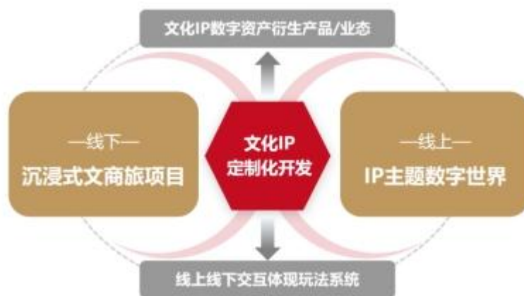
图 10: LBE 项目经营模式示意图

公司 LBE 项目主要定位于新文旅、新文娱、新商业领域，通过故事创意、场地游戏玩法设计、数字特效等内容创作以及特殊装置及设备、用户交互系统等研发制作提升线下主题场馆/主题景区的内容表现力。该业务经营模式主要为：（1）甲方提出项目需求，公司提供顶层概念设计、规划咨询、产品体系、产品配置及投资、运营管理、项目开发模式等全产业链一站式服务。公司与甲方签署合作协议后，按照双方约定的项目计划书，公司自有团队主创定制化内容部分的概念体验设计（包含创意设计、世界观设计、综合体验设计、多媒体装置设计）和建筑展陈设计，一般将建筑施工设计及工程实施环节外包，最终负责完成终验交付甲方使用。合作模式上，公司有定向咨询服务、项目设计委托、EPC 单体项目交钥匙工程、OM 运营委托、EPCO 模式、FEPCO 项目融资模式等。（2）文商旅互动平台通过线上线下结合的统一经济系统，积累线上活跃度和用户权益，吸引复游复购并提高消费转化，形成娱乐体验、广告投放、体验收费、商品销售、版权收益等线上线下相结合的盈利模式。（3）公司依托在 XR 创意与技术领域的积累，将电影产业与 XR 技术相结合，创新应用于电影 IP 的推广，为 XR 创意与技术提供了 LBE 体验实践场景。